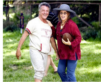
2004 MON BEAU-PÈRE, MES PARENTS ET MOI (Meet the Fockers) de Jay Roach avec B. Streisand