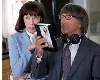
2004 J'ADORE HUCKABEES (I heart Huckabees) de David O. Russell avec Lily Tomlin