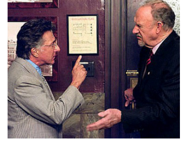
2003 LE MAÎTRE DU JEU (Runaway Jury) de Gary Fleder avec Gene Hackman