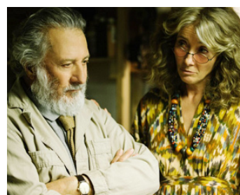
2017 MEYEROWITZ STORIES (New and Selected) de Noah Baumbach avec Emma Thompson