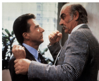
1989 UNE AFFAIRE DE FAMILLE (Family Business) de Sidney Lumet avec Sean Connery