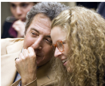
2006 L'INCROYABLE DESTIN D'HAROLD CRICK (Stranger than Fiction) de M. Forster avec Lindsay Doran