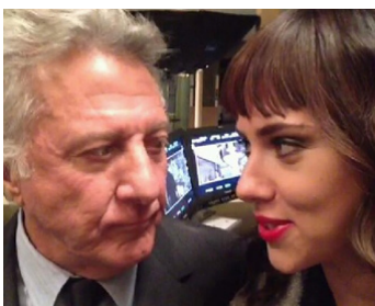
2014 CHEF (# Chef) de Jon Favreau avec Scarlett Johansson