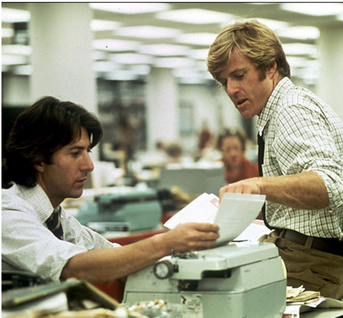
1976 LES HOMMES DU PRÉSIDENT (All the President's Men) d' Alan J. Pakula avec Robert Redford