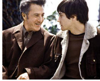
2002 MOONLIGHT MILE (Moonlight Mile) de Brad Silberling avec Jack Gyllenhaal