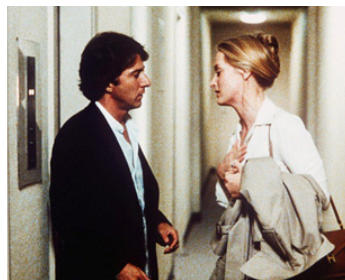
1979 KRAMER CONTRE KRAMER (Kramer vs Kramer) de Robert Benton avec Meryl Streep