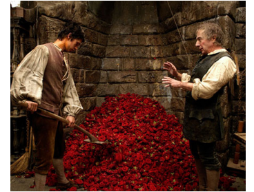
2006 LE PARFUM (Perfume, the Story of a Murderer) de Tom Tykwer avec Ben Whishaw