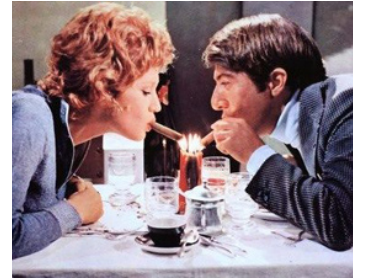
1972 ALFREDO, ALFREDO (Alfredo, Alfredo) de Pietro Germi avec Carla Gravina