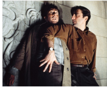
1992 HÉROS MALGRÉ LUI (Hero) de Stephen Frears avec Andy Garcia