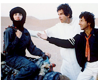
1987 ISHTAR (Ishtar) d' Elaine May avec Isabelle Adjani, Warren Beatty