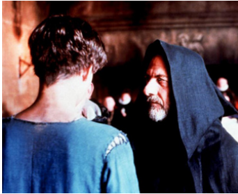
1999 JEANNE D'ARC (The Messenger, the Story of Joan of Arc) de Luc Besson