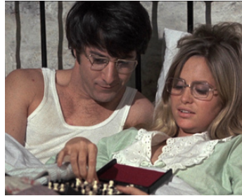
1971 LES CHIENS DE PAILLE (Straw Dogs) de Sam Peckinpah avec Susan George