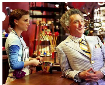
2008 LE MERVEILLEUX MAGASIN DE MONSIEUR MAGORIUM de Zach Helm avec Natalie Portman