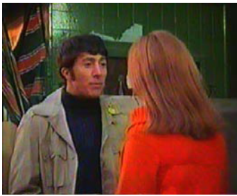
1967 THE TIGER MAKES OUT d' Arthur Hiller avec Michelle Kesten