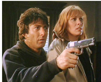
1976 MARATHON MAN (Marathon Man) de John Schlesinger avec Marthe Keller