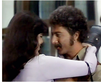
1971 QUI EST HARRY KELLERMAN (Who is Harry Kellerman...) d'U. Grosbard avec Barbara Harris