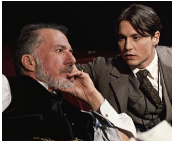
2004 NEVERLAND (Neverland) de Marc Forster avec Johnny Depp