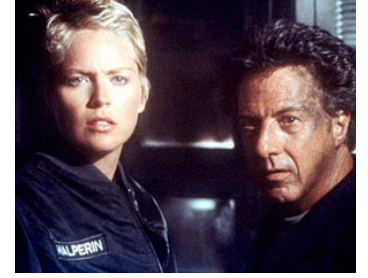
1998 SPHÈRE (Sphere) de Barry Levinson avec Sharon Stone