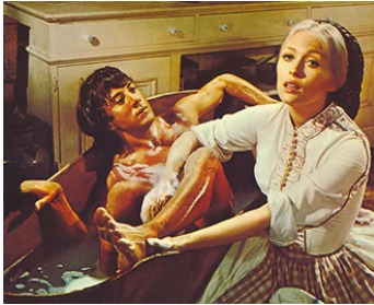
1970 LITTLE BIG MAN (Little Big Man) d' Arthur Penn avec Faye Dunaway