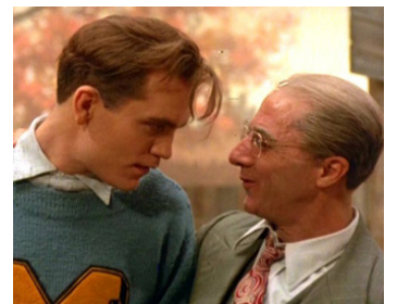
1985 MORT D'UN COMMIS VOYAGEUR (Death of a Salesman) de V. Schlöndorff avec J. Malkovich