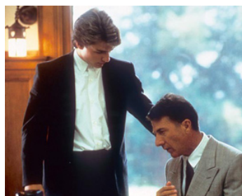
1988 RAIN MAN (Rain Man) de Barry Levinson avec Tom Cruise