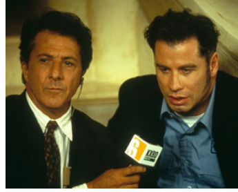
1997 MAD CITY (Mad City) de Costa-Gavras avec John Travolta