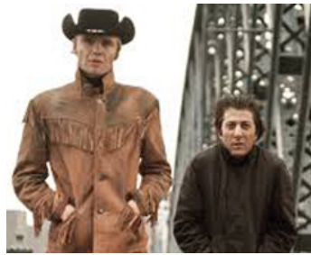
1969 MACADAM COWBOY (Midnight Cowboy) de John Schlesinger avec Jon Voight