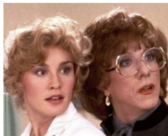
1982 TOOTSIE (Tootsie) de Sydney Pollack avec Jessica Lange