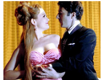
1974 LENNY (Lenny) de Bob Fosse avec Valerie Perrine