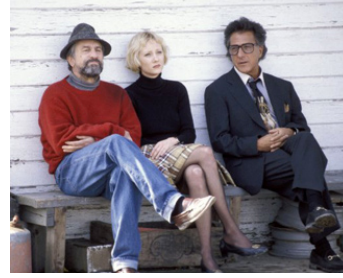
1997 DES HOMMES D'INFLUENCE (Wag the Dog) de B. Levinson avec R. De Niro, Anne Heche