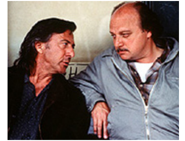
1996 AMERICAN BUFFALO (American Buffalo) de Michael Corrente avec Dennis Franz