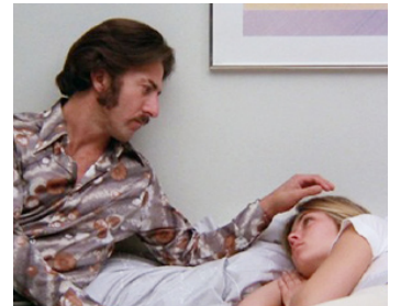
1978 LE RÉCIDIVISTE (Straight Time) d'Ulu Grosbard avec Theresa Russell