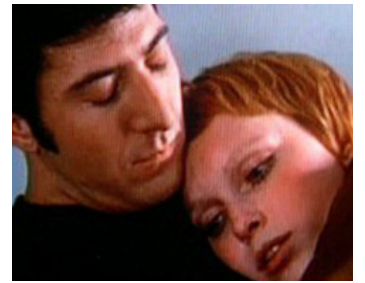
1969 JOHN ET MARY (John and Mary) de Peter Yates avec Mia Farrow