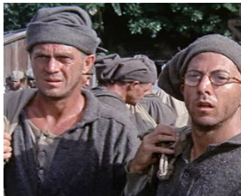
1973 PAPILLON (Papillon) de Franklin J. Schaffner avec Steve McQueen