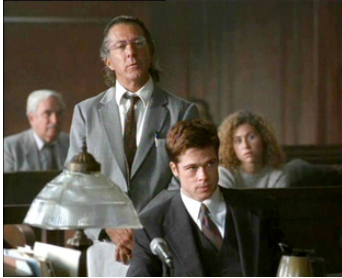
1996 SLEEPERS (Sleepers) de Barry Levinson avec Brad Pitt, Minnie Driver