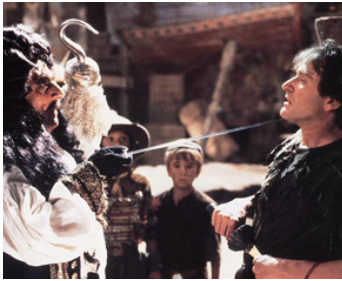
1991 HOOK ou LA REVANCHE DU CPT CROCHET (Hook) de S. Spielberg avec Robin Williams