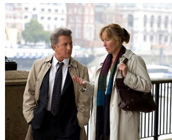
2009 LAST CHANCE FOR LOVE (Last Chance for Love) de Joel Hopkins avec Emma Thompson