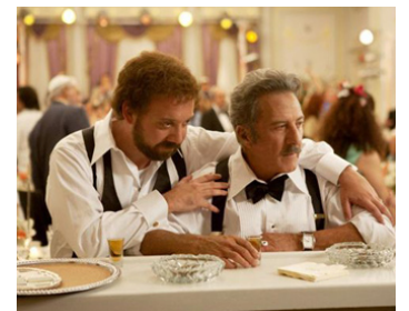
2011 LE MONDE DE BARNEY (Barney's Version) de Richard J. Lewis avec Paul Giamatti