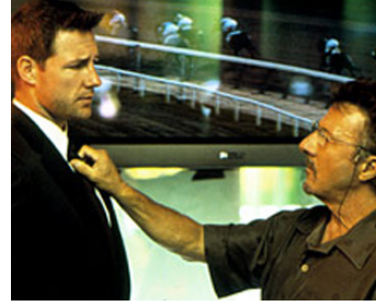
2003 CONFIDENCE (Confidence) de James Foley avec Edward Burns