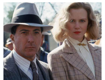
1991 BILLY BATHGATE (Billy Bathgate) de Robert Benton avec Nicole Kidman