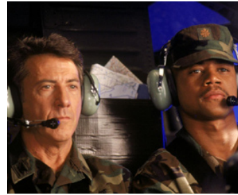
1995 ALERTE ! (Outbreak) de Wolfgang Petersen avec Cuba Gooding Jr